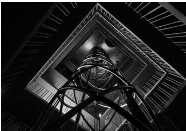
Jerry-Louis Ruff Thema: schwarz/weiß