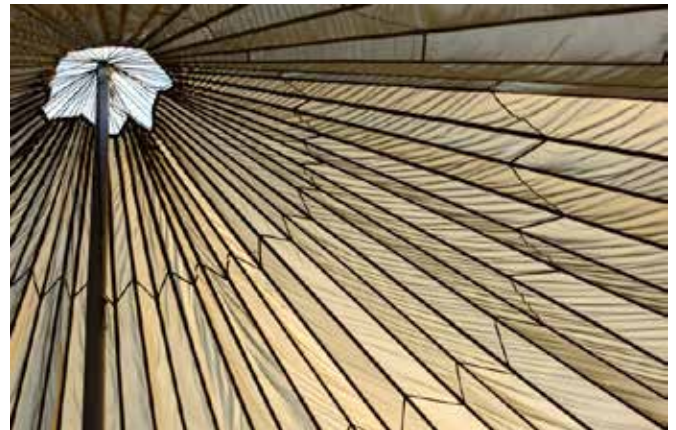
Wilfried Weis Thema: Linien