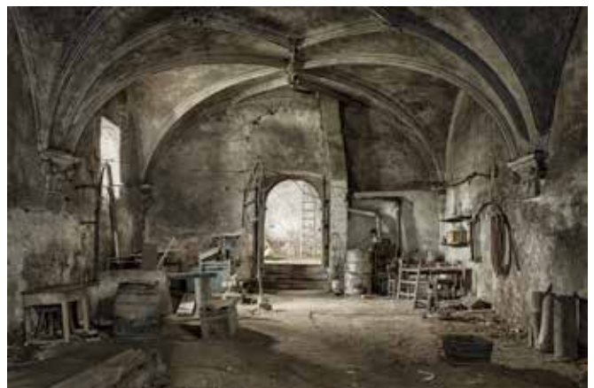
„Krypta Kloster Zell“ BEZIFO Ehrenpreis 2017 in Karlstadt